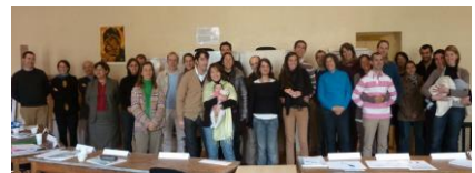
Bordeaux – mars 2012