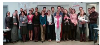
Paris – mars 2012